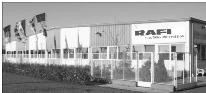
A Rafi épülete