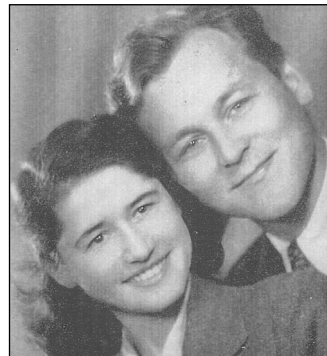
A felhőtlen időkben