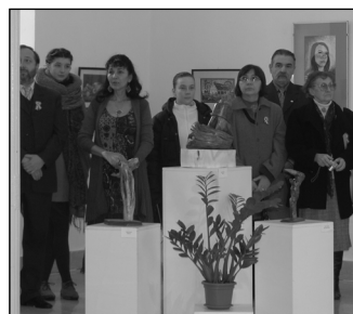
Rajztanárok kiállítása a városi Galériában, 2013. április 27-ig

A műsort követően a koszorúk elhelyezésére került sor a Kossuth szobornál.