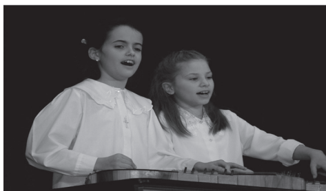
Gyermek és Ifjúsági Citerazenekarok 24. Túri Találkozója 2024. december 7. Mezőtúr Információ: +36/20/912-8001

Küldje be a helyes megfejtést az ujsag@mkskft.hu e-mail címre vagy küldje el privát üzenetben a Mezőtúr és Vidéke Facebook oldalán, nevével és telefonszámával együtt vagy hozza be személyesen a Községi Ház portájára elérhetőségeivel együtt november 21-ig! A helyes megfejtők között páros mozijegyet sorsolunk ki!