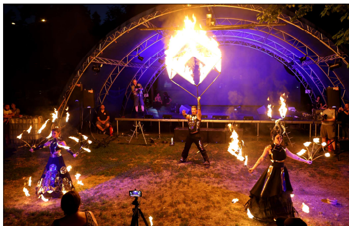
Katasztrófavédelmi Kirendeltséggel egyeztetve egy kisméretű máglyával

A nyári kánikula ellenére többen választottak bennünket péntek délután. Az esemény a REX Mentőkutyás bemutatóval kezdődött, majd a Mezőtúri Bárdos Lajos Alapfokú Művészeti Iskola balet tanzakos növendékei nyitották meg a színpadi programokat.